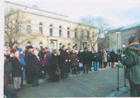
Remembering at the Jewish Memorial