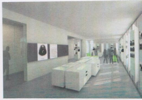
as it will look when finished