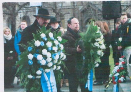
Hanover Jews lay wreaths at the Memorial