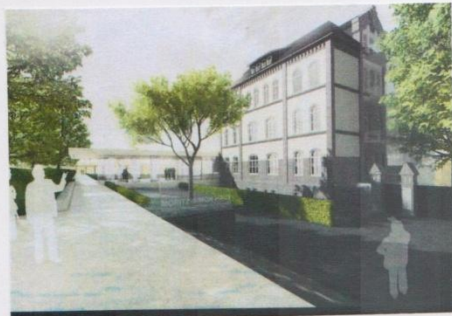
The new Gedenkstätte Ahlem: