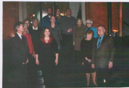
Farewell pix with guests-of-honor